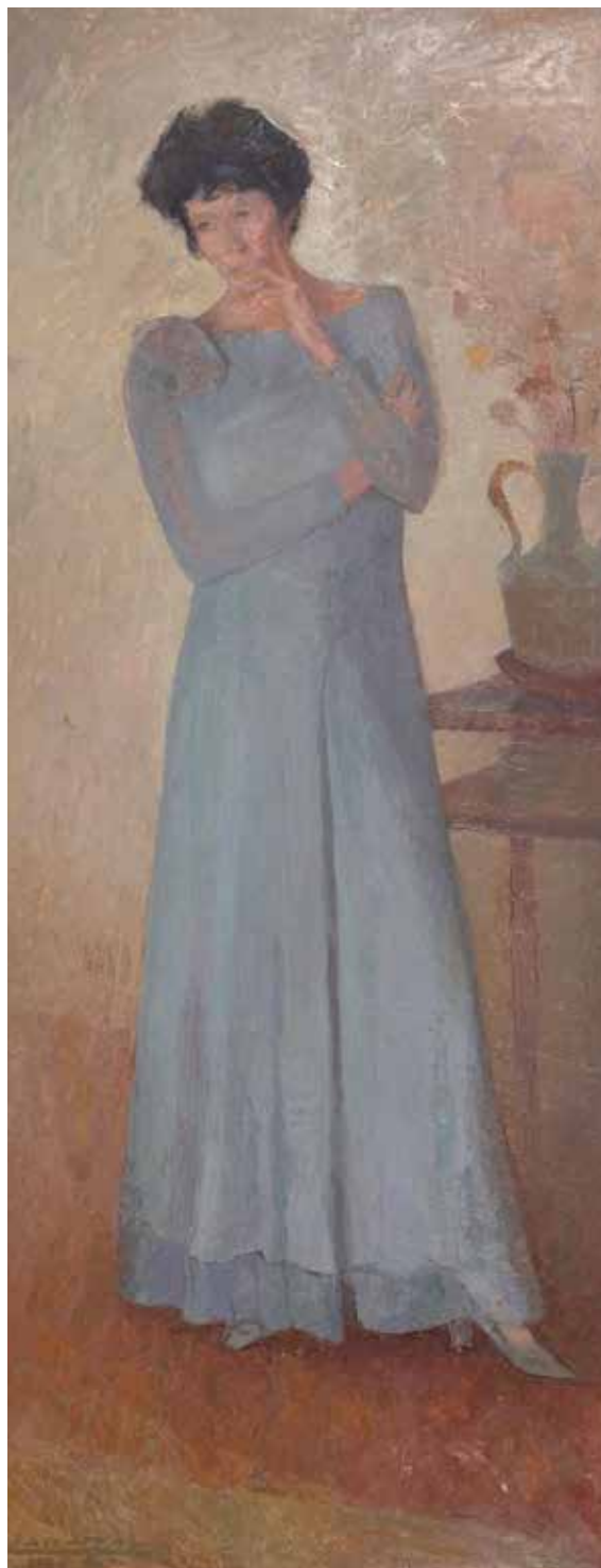
Retrato de Eudoxia Estrella por Guillermo Larrazábal (óleo sobre madera)

Desde los primeros borradores en los que se había incorporado el Seminario Taller de Introducción a la Forestación, con su carácter de 'síncresis' inicial (en la que, a diferencia de la síntesis, no se establecen relaciones entre las partes, sino que se apunta a una captación global que habilita la comprensión del sentido y permite anclajes en conocimientos y saberes previos del estudiantado), nos preocupaba que los momentos analíticos radicados en las distintas asignaturas condujeran a una atomización. Es decir, se planteaban los recorridos desde los alumnos y no exclusivamente desde la lógica de las disciplinas y su referencia a lo conceptual. Fue así que se resolvió, a nivel del segundo cuatrimestre de segundo año, disponer un espacio para un taller de integración conceptual, basado en problemas