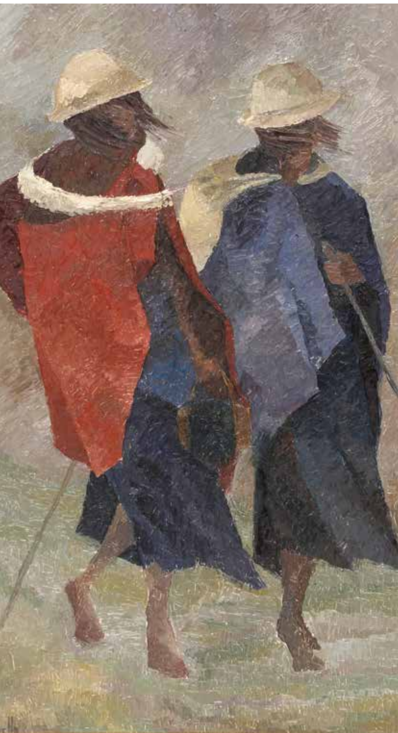
Indígenas de Colta (acuarela)

los participantes (directo: los representantes ante la mesa, e indirecto: los docentes de los IFD que reflexionaban y discutían con los representantes las distintas problemáticas), un proceso de formación reflexiva sobre sus prácticas. Los representantes acercaban a los IFD material bibliográfico al que se apelaba en las discusiones de la mesa, procediendo a una actualización bibliográfica permanente e igualitaria para todos los IFD, incluso los de zonas apartadas que habitualmente quedan excluidos de los circuitos de actualización. La reflexión sobre la práctica ponía en tensión, pues, aspectos experienciales y marcos teóricos.