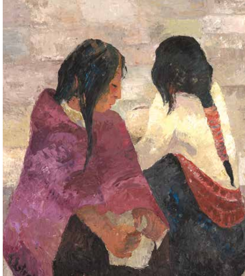
Indígena “La abuela” (óleo sobre cartón)

La metodología propia de la investigación-acción –que se encuadra en las metodologías par-