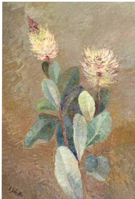
Planta medicinal (óleo)

Los integrantes de la mesa, tal como consta en la documentación presentada, manifestaron que su intención era la de promover una participación real en el proceso de elaboración del documento. Definieron la “participación real” como aquella por la cual “los miembros de una institución o grupo influyen efectivamente sobre todos