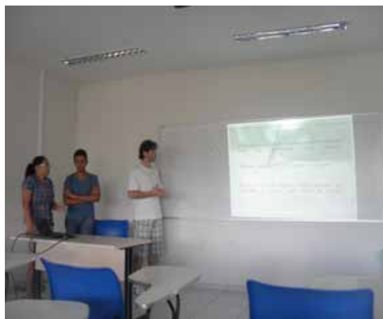
Figura 4: Egresados de Prácticas I presentando en 2013.2 resultados de 2013.1 acerca de la investigación “¿Qué es una escuela de calidad?”.

En medio a las observaciones ocurridas durante el período de 2012.2 vigente de las Prácticas Supervisadas de Formación de Profesores I (Ciencias Biológicas) hubo un levantamiento de datos acerca de la temática “¿Para qué sirve una escuela?”, cuando estos datos fueron recolectados por los monitores, todavía en condición de practicantes de PEC1079. Ese levantamiento de datos se dio a partir de las respuestas de dicentes, docentes, padres, madres y servidores de escuelas públicas de Natal/RN. A partir de ese trabajo constante de investigación, fue posible pre-