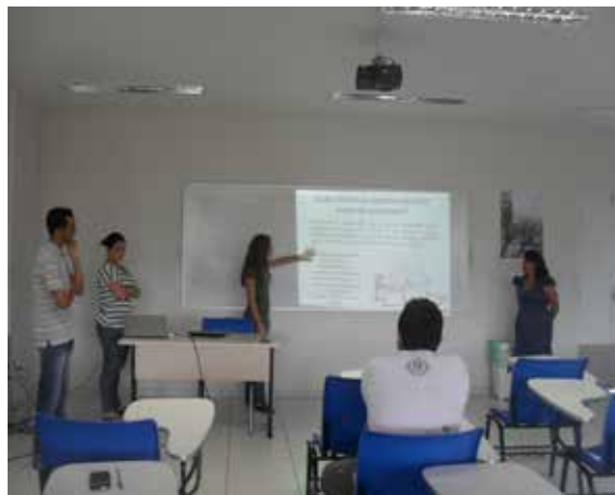
Figura 2: Dicentes de Prácticas I presentando a sus pares resultados de 2013.1 acerca de la investigación “¿Qué es una escuela de calidad?”.