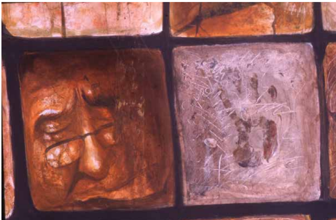
VIDA A CUADRITOS (FRAGMENTO) Acrílico sobre tela 2X150

fundamentado en la ecosofía de Guattari , para quien enseñar implicaría promover prácticas innovadoras y diseminar experiencias alternativas, “centradas en el respeto a la singularidad y en el trabajo permanente de producción de subjetividad” (Guattari, 2005: 44).