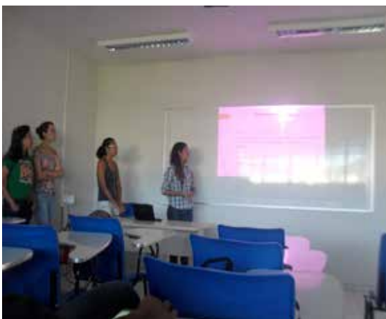
Figura 3: Dicentes de Prácticas I presentando a sus pares resultados de 2013.2 acerca de la investigación “¿Qué hace que al alumno le guste su escuela?”.